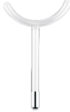
Y shape tube