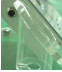
Mesogun'u takmak için.