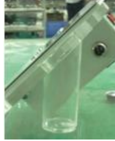
İletken probu takmak için.