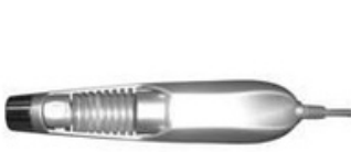
Serum şişeli Mezoterapi